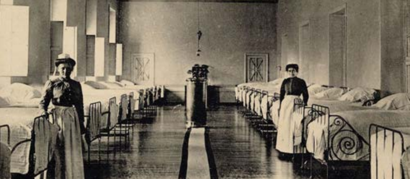
Dortoir de l'hôpital de Sainte Gemmes début du XX e