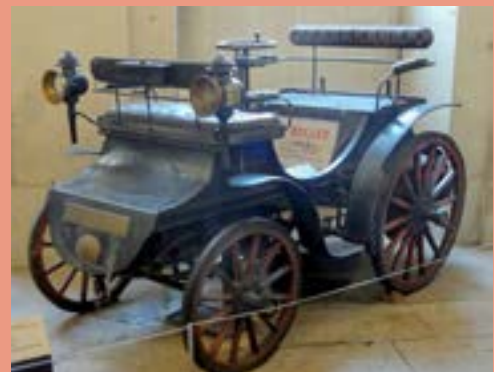
Voiture Bollée de 1895