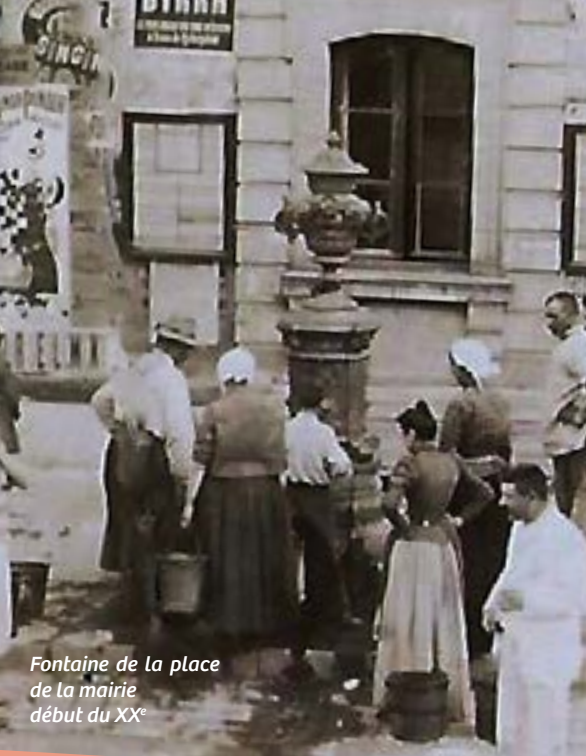
Fontaine de la place de la mairie début du XX e