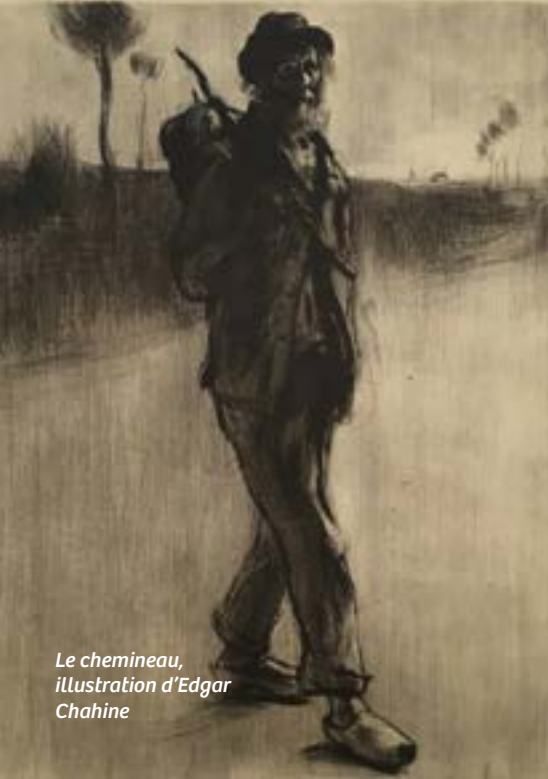
Le chemineau, illustration d'Edgar Chahine