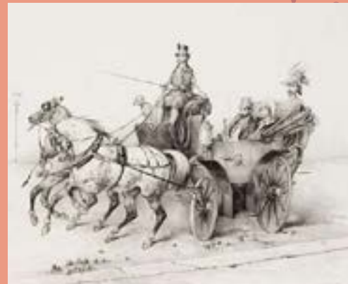
Calèche Tilbury, gravure de 1845

Une enquête est ouverte par la gendarmerie de St Georges.