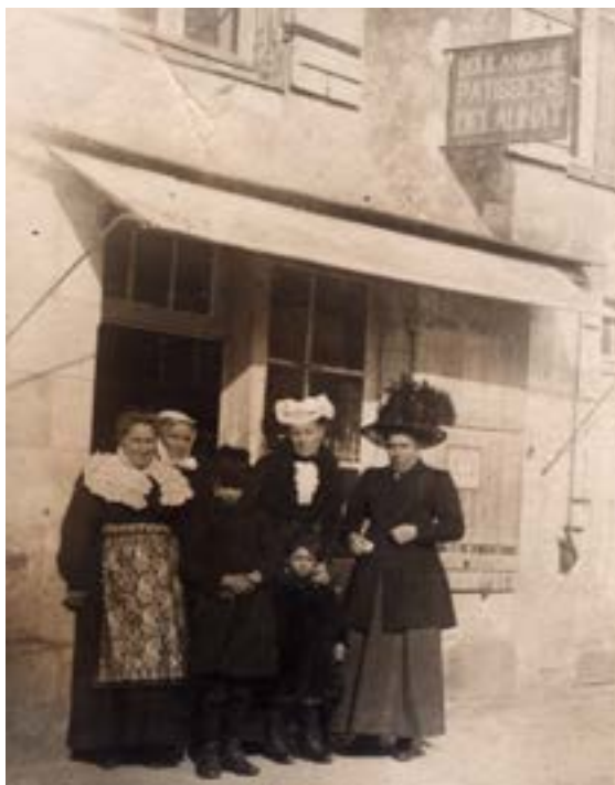
Femmes devant la boulangerie Delaunay dans le bourg